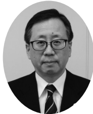
千代田都税事務所長

着用や手指の消毒などを行うこととしております。また例年、青色申告制度の説明等を行うために役員の皆様方にご協力をいただき開設しております「青色コーナー」でも万全の感染予防対策を講じる予定です。 本年も、確定申告事務を円滑に進めてまいりたいと考え